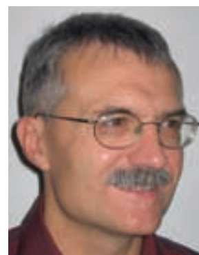
Fortunat Joos Physikalisches Institut, Klima- und Umweltphysik und Oeschger Zentrum für Klimaforschung, Universität Bern

5000 Gigatonnen Kohlenstoff als CO 2 in die Luft, finden wir in 3000 Jahren immer noch einen Viertel davon in der Atmosphäre (siehe rote Kurven in Abb.). Die mittlere Oberflächentemperatur schnell in die Höhe und verharrt während Jahrtausenden auf rund 6°C. Der Grund ist klar. CO 2 ist chemisch sta